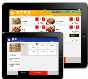
カスタマディスプレイ