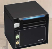
レシートプリンタ